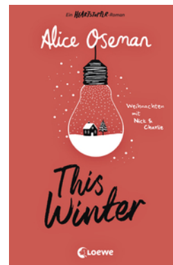
This Winter (deutsche Ausgabe)