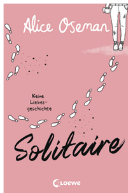
Solitaire (deutsche Ausgabe)