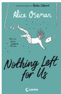
Nothing Left for Us (deutsche Ausgabe von Radio Silence)