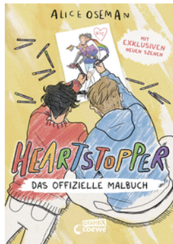
Heartstopper - Das offizielle Malbuch