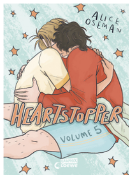
Heartstopper Volume 5 (deutsche Hardcover-Ausgabe)