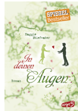
In deinen Augen