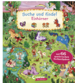
Suche und finde! Einhörner