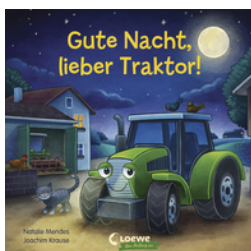
Gute Nacht, lieber Traktor!