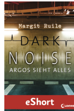
Dark Noise - Argos sieht alles