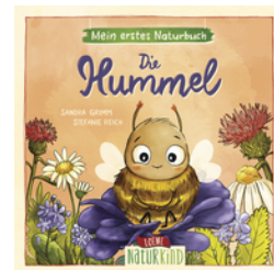
Mein erstes Naturbuch - Die Hummel