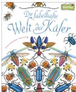
Die fabelhafte Welt der Käfer