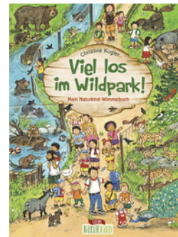
Viel los im Wildpark!