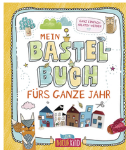
Mein Bastelbuch fürs ganze Jahr