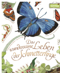
Das wundersame Leben der Schmetterlinge