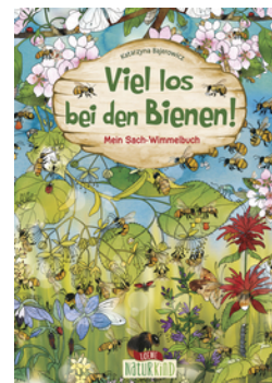
Viel los bei den Bienen!