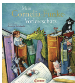
Mein Cornelia-Funke- Vorleschatz