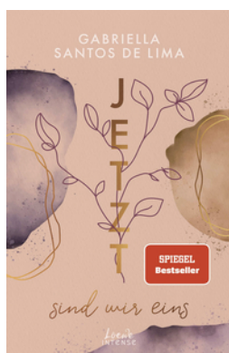
Jetzt sind wir eins (Jetzt-Trilogie, Band 2)