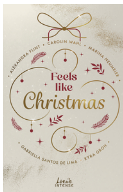
Feels like Christmas