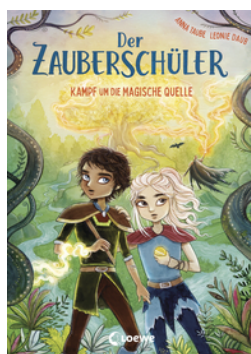
Der Zauberschüler (Band 4) - Kampf um die Magische Quelle