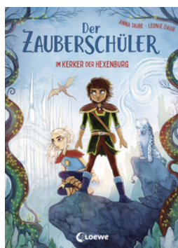
Der Zauberschüler (Band 5) - Im Kerker der Hexenburg