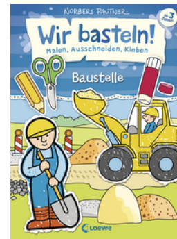
Wir basteln! - Malen, Ausschneiden, Kleben - Baustelle