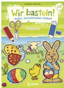
Wir basteln! - Malen, Ausschneiden, Kleben - Ostern