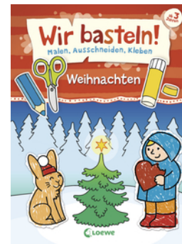
Wir basteln! - Malen, Ausschneiden, Kleben - Weihnachten