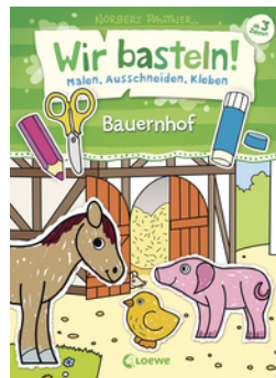
Wir basteln! - Malen, Ausschneiden, Kleben - Bauernhof