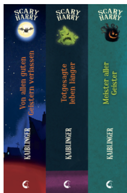
Scary Harry (Band 1-3)