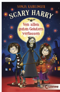
Scary Harry (Band 1) - Von allen guten Geistern verlassen