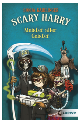
Scary Harry (Band 3) - Meister aller Geister