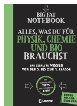
Big Fat Notebook - Alles, was du für Physik, Chemie und Bio brauchst - Das geballte Wissen von der 5. bis zur 9. Klasse. Mit Bonuswissen: Erdkunde