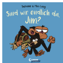
Sind wir endlich da, Jim?