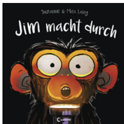
Jim macht durch