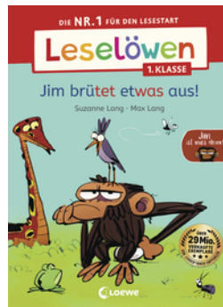
Leselöwen 1. Klasse - Jim ist mies drauf - Jim brütet etwas aus!