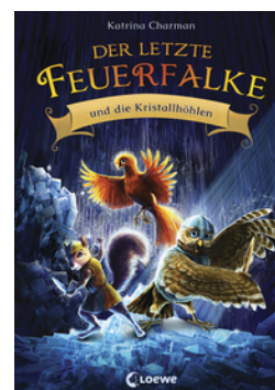
Der letzte Feuerfalk und die Kristallhöhlen (Band 2)