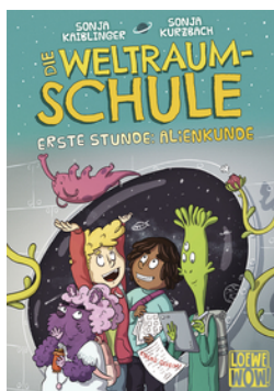
Die Weltraumschule (Band 1) - Erste Stunde: Alienkunde