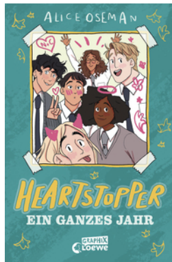
Heartstopper - Ein ganzes Jahr (Yearbook)