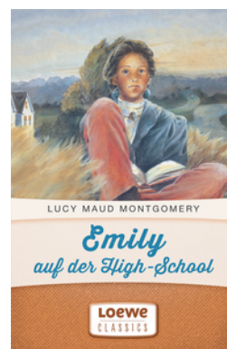
Emily auf der High-School