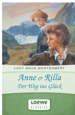
Anne & Rilla - Der Weg ins Glück