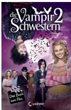
Die Vampirschwestern 2 – Das Buch zum Film