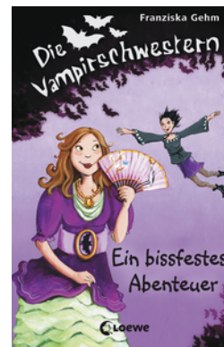
Die Vampirschwestern (Band 2) - Ein bissfestes Abenteuer