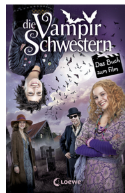
Die Vampirschwestern – Das Buch zum Film