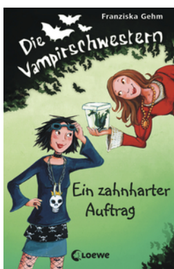
Die Vampirschwestern (Band 3) - Ein zahnharter Auftrag