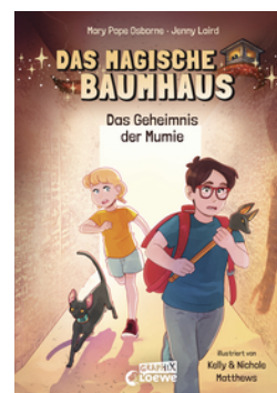
Das magische Baumhaus (Comic-Buchreihe, Band 3) - Das Geheimnis der Mumie