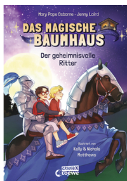
Das magische Baumhaus (Comic-Buchreihe, Band 2) - Der geheimnisvolle Ritter