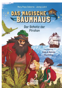
Das magische Baumhaus (Comic-Buchreihe, Band 4) - Der Schatz der Piraten