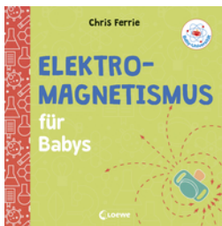
Baby-Universität - Elektromagnetismus für Babys