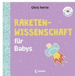
Baby-Universität - Raketenwissenschaft für Babys