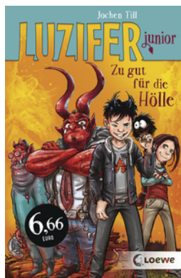
Luzifer junior (Band 1) - Zu gut für die Hölle