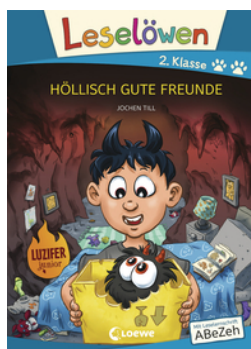
Leselöwen 2. Klasse - Höllisch gute Freunde (Großbuchstabenausgabe)