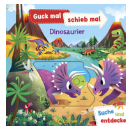
Guck mal, schieb mal! Suche und entdecke - Dinosaurier