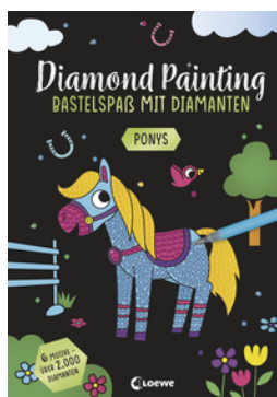
Diamond Painting - Bastelspaß mit Diamanten - Ponys