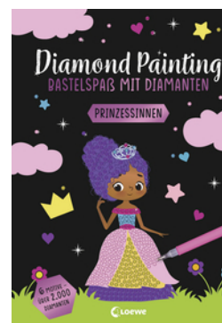
Diamond Painting - Bastelspaß mit Diamanten - Prinzessinnen