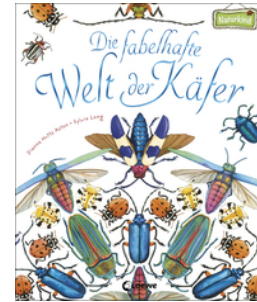
Die fabelhafte Welt der Käfer