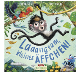
Laaangsam, kleines Äffchen!