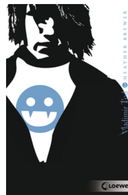
Vladimir Tod beisst sich durch (Band 2)