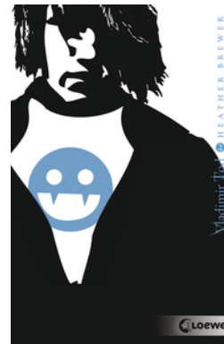
Vladimir Tod beisst sich durch (Band 2)