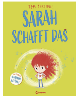
Sarah schafft das (Die Reihe der starken Gefühle)