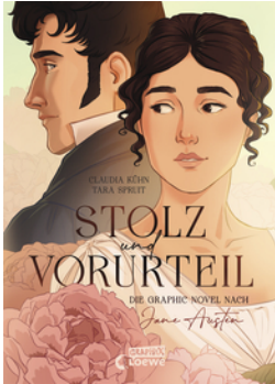
Stolz und Vorurteil