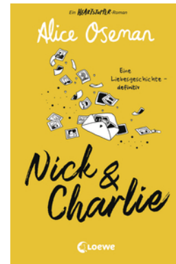
Nick & Charlie (deutsche Ausgabe)