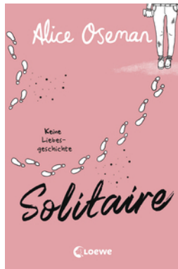
Solitaire (deutsche Ausgabe)