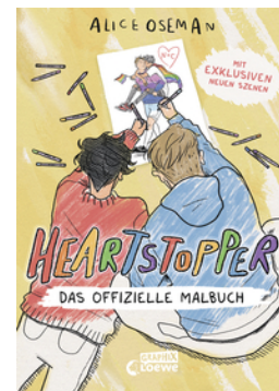
Heartstopper - Das offizielle Malbuch