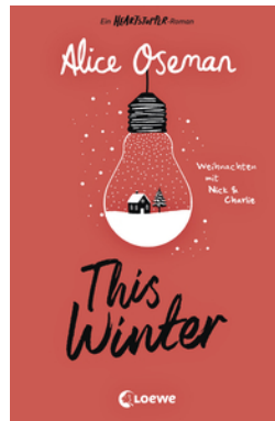
This Winter (deutsche Ausgabe)