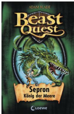
Beast Quest (Band 2) - Sepron, König der Meere