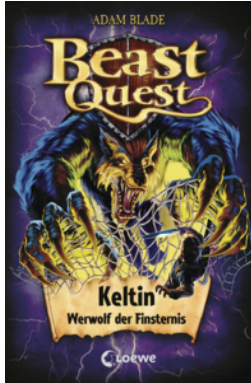
Beast Quest (Band 68) - Keltin, Werwolf der Finsternis