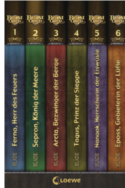
Beast Quest (Band 1-6)