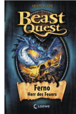
Beast Quest (Band 1) - Ferno, Herr des Feuers