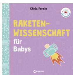
Baby-Universität - Raketenwissenschaft für Babys