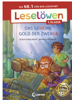
Leselöwen 1. Klasse - Das geheime Gold der Zwerge (Großbuchstabenausgabe)