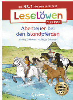
Leselöwen 1. Klasse - Abenteuer bei den Islandpferden