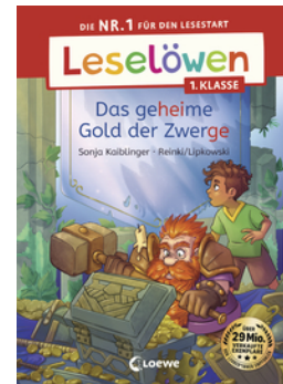
Leselöwen 1. Klasse - Das geheime Gold der Zwerge