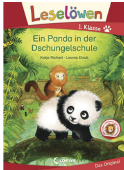
Leselöwen 1. Klasse - Ein Panda in der Dschungelschule