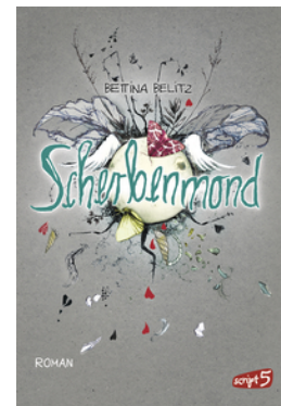
Splitterherz – Scherbenmond