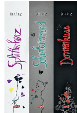
Splitterherz, Scherbenmond, Dornenkuss – Die komplette Trilogie