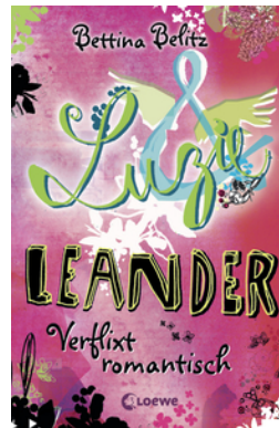
Luzie & Leander - Verflixt romantisch