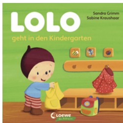
Lolo geht in den Kindergarten