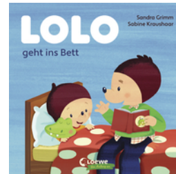
Lolo geht ins Bett