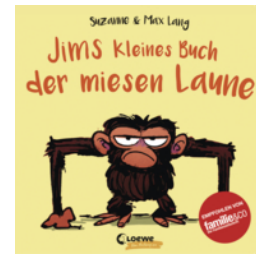
Jims kleines Buch der miesen Laune