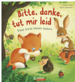
Bitte, danke, tut mir leid