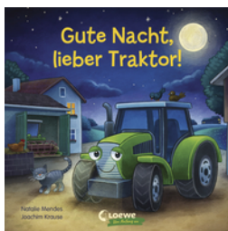
Gute Nacht, lieber Traktor!