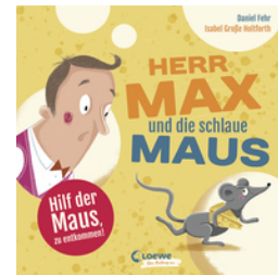
Herr Max und die schlaue Maus