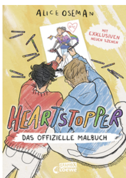
Heartstopper - Das offizielle Malbuch