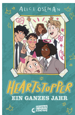
Heartstopper - Ein ganzes Jahr (Yearbook)