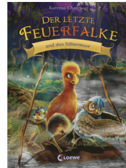
Der letzte Feuerfalke und das Silbermoor (Band 8)