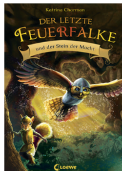
Der letzte Feuerfalke und der Stein der Macht (Band 1)