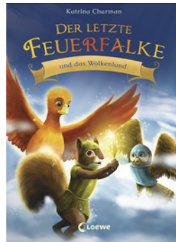
Der letzte Feuerfalke und das Wolkenland (Band 7)