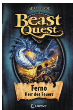
Beast Quest (Band 1) - Ferno, Herr des Feuers