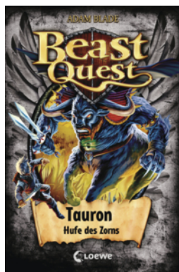
Beast Quest (Band 66) - Tauron, Hufe des Zorns