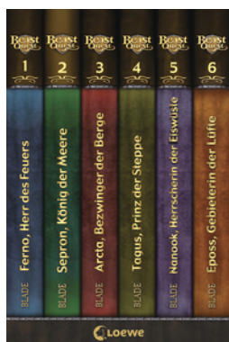
Beast Quest (Band 1-6)