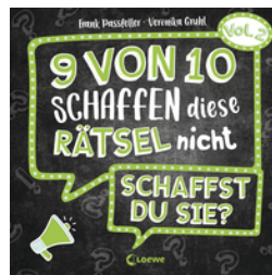
9 von 10 schaffen diese Rätsel nicht - schaffst du sie? - Vol. 2