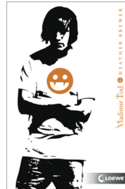
Vladimir Tod kämpft verbissen (Band 4)