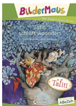
Bildermaus - Tafiti schläft woanders