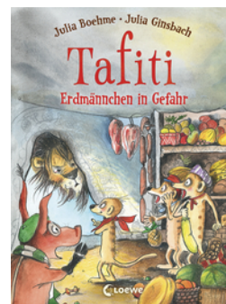
Tafiti (Band 23) - Erdmännchen in Gefahr