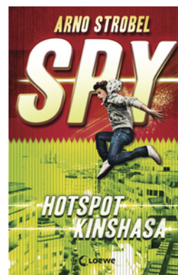
SPY (Band 2) - Hotspot Kinshasa