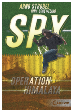
SPY (Band 3) - Operation Himalaya