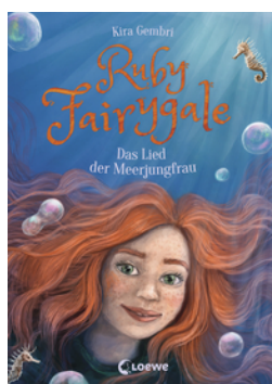
Ruby Fairygale (Band 7) - Das Lied der Meerjungfrau