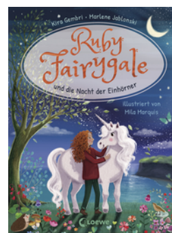
Ruby Fairygale und die Nacht der Einhörner (Erstlese-Reihe, Band 4)