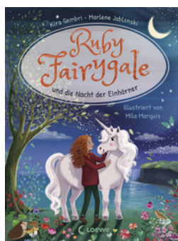
Ruby Fairygale und die Nacht der Einhörner (Erstlese-Reihe, Band 4)