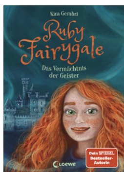
Ruby Fairygale (Band 6) - Das Vermächtnis der Geister