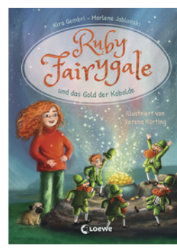
Ruby Fairygale und das Gold der Kobolde (Erstlese-Reihe, Band 3)