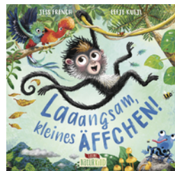
Laaangsam, kleines Äffchen!