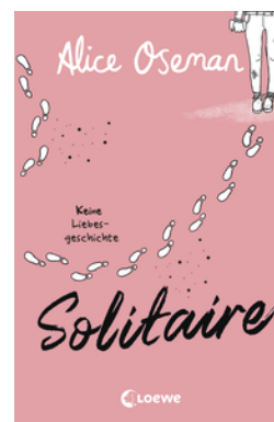
Solitaire (deutsche Ausgabe)