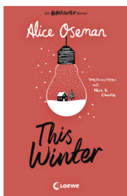
This Winter (deutsche Ausgabe)