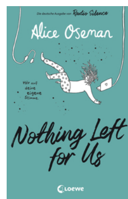
Nothing Left for Us (deutsche Ausgabe von Radio Silence)