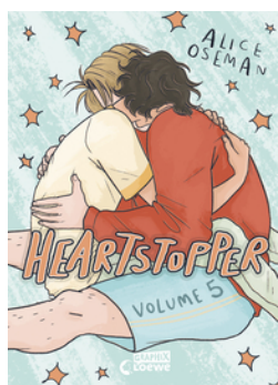
Heartstopper Volume 5 (deutsche Hardcover-Ausgabe)