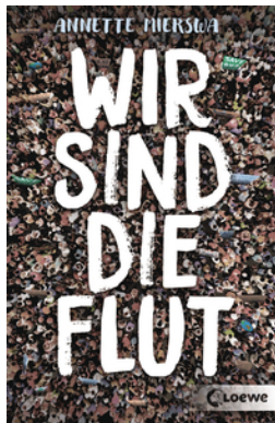
Wir sind die Flut