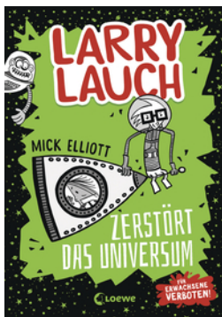
Larry Lauch zerstört das Universum (Band 2)