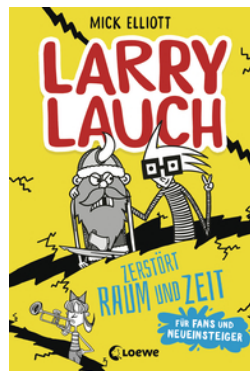
Larry Lauch zerstört Raum und Zeit