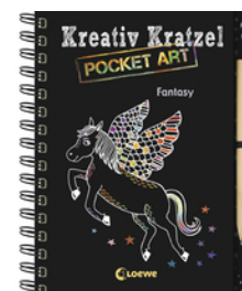
Kreativ-Kratzel Pocket Art: Fantasy