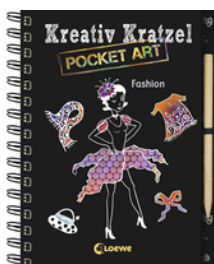
Kreativ-Kratzel Pocket Art: Fashion