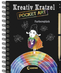
Kreativ-Kratzel Pocket Art: Farbenglück