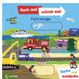
Guck mal, schieb mal! Suche und entdecke - Fahrzeuge